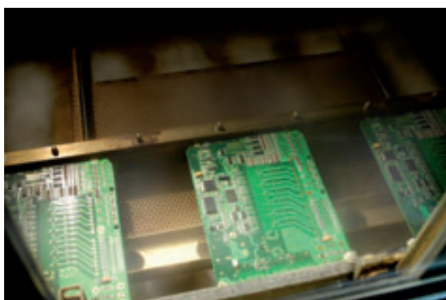
Fig. 1 - La saldatura in forno "vapour phase" consente la migliore qualità per il processo "lead free"

Questa evoluzione colpisce maggiormente le aziende e i settori in cui l'elettronica costituisce una parte marginale, anche se spesso strategica, del prodotto, in cui le dimensioni della parte elettronica in termini di fatturato e risorse umane sono insufficienti per far fronte al cambiamento o in cui progettazione e produzione sono separate: in questo caso la parte di progettazione è integrata nella R&D del prodotto non elettronico e la produzione affidata a fornitori esterni.