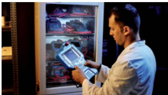
Fig. 3 - Il collaudo in camera climatica consente di verificare il funzionamento degli apparati anche in condizioni di temperature estreme

Per i circuiti ad alta densità, si stanno affermando sempre di più metodologie di collaudo basate su ispezione ottica automatizzata, (sia visibile che X-ray). La disponibilità di questo tipo di macchine aumenta la libertà di manovra nella realizzazione di schede elettroniche, ma contemporaneamente si rende necessario