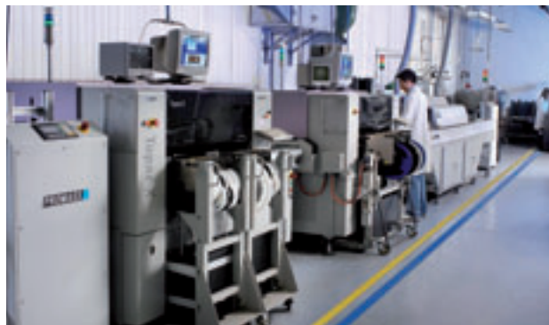
Fig. 4 - Dal 1988 le attività di montaggio delle schede SMT sono state integrate in azienda, in modo da ottenere il controllo diretto di tutte le componenti chiave del processo produttivo

tenerne conto sia nella scelta dei componenti sia nella definizione della strategia complessiva di controllo qualità.